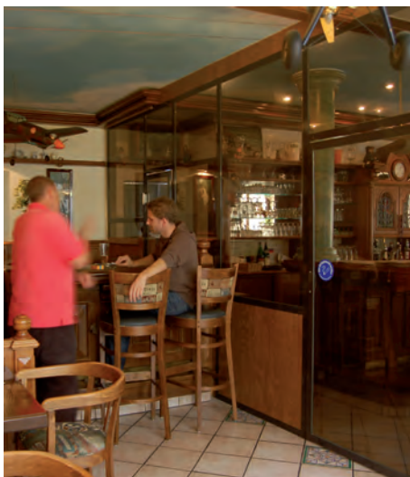
■ Erfahrungen aus anderen Kantonen zeigen, dass der grösste Teil der Gastbetriebe rauchfrei bleibt.

Viele Betriebe werden (vor allem aus Marketinggründen) rauchfrei bleiben. Von den 255 genannten Betrieben zählen 50 zum Bereich Schnellverpflegung und 21 zu den Speiselokalen. Es verbleiben 184 Lokale, die getränkegeprägt sind. Von diesen wird sich wohl eine Mehrheit für die Option «Raucherlokal» entscheiden.