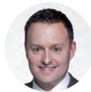
Dr. Sebastian Frehner Nationalrat, Präsident SVP Basel-Stadt

entscheiden, welche Lösung er bevorzugen will. Das führt zu einem guten Miteinander zwischen Rauchern und Nichtrauchern und schützt unsere hiesige «Beizen-Szene» vor dem mittelfristigen Aussterben.