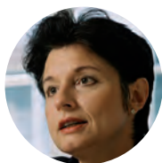
Anita Fetz, Ständerätin

Ich habe mich im Ständerat für einen schweizweit gleichen Nichtraucherschutz eingesetzt. Dieser soll auch in Basel-Stadt gelten. Es macht doch keinen Sinn, dass wir in der Schweiz 26 verschiedene Lösungen haben. Deshalb unterstütze ich die Initiative.