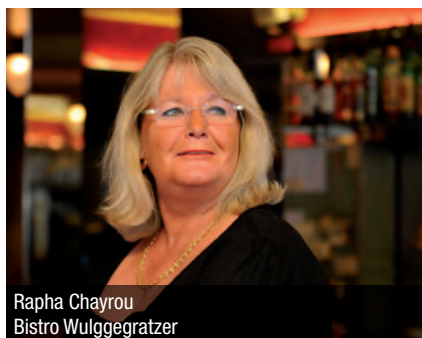
Rapha Chayrou Bistro Wulgegegratzer

«Momentan überleben wir dank einer Vereinslösung. Gerne würden wir unsere kleine Bar künftig wieder öffentlich zugänglich führen – als klar gekennzeichnetes Raucherlokal.»